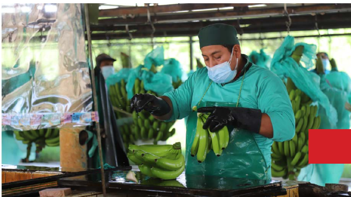
Mincetur apoya a pymes con criterios de sostenibilidad.

De esta forma, las micro, pequeñas y medianas empresas del país, que realizan sus procesos productivos con criterios ambientales, podrán acceder al financiamiento de hasta el 90 % del total de su proyecto de exportación, lo que beneficia a las compañías que han priorizado la conservación de los recursos naturales desde el inicio de sus operaciones. En el evento de lanzamiento de la nueva convocatoria del PAI, los participantes recibieron información sobre las bases del concurso y los requisitos a cumplir para la consolidación de sus objetivos de exportación, apalancados con desembolsos que van desde los 70,000 hasta los 300,000 soles. Al respecto, el director general de Economía y Financiamiento