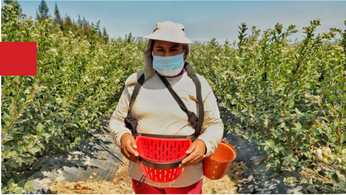
Mincetur apoya a pymes con criterios de sostenibilidad.

Ambiental del Ministerio del Ambiente (Minam), Elvis García, mencionó que “el PAI es el primer instrumento de fomento público en incorporar criterios ambientales relativos a la conservación de la biodiversidad, demostrando el potencial uso estratégico del financiamiento público para incentivar a empresas sostenibles”.