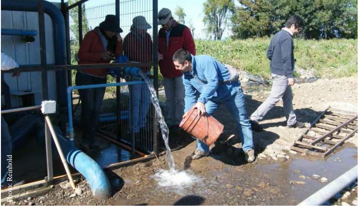
قياس تدفق المياه