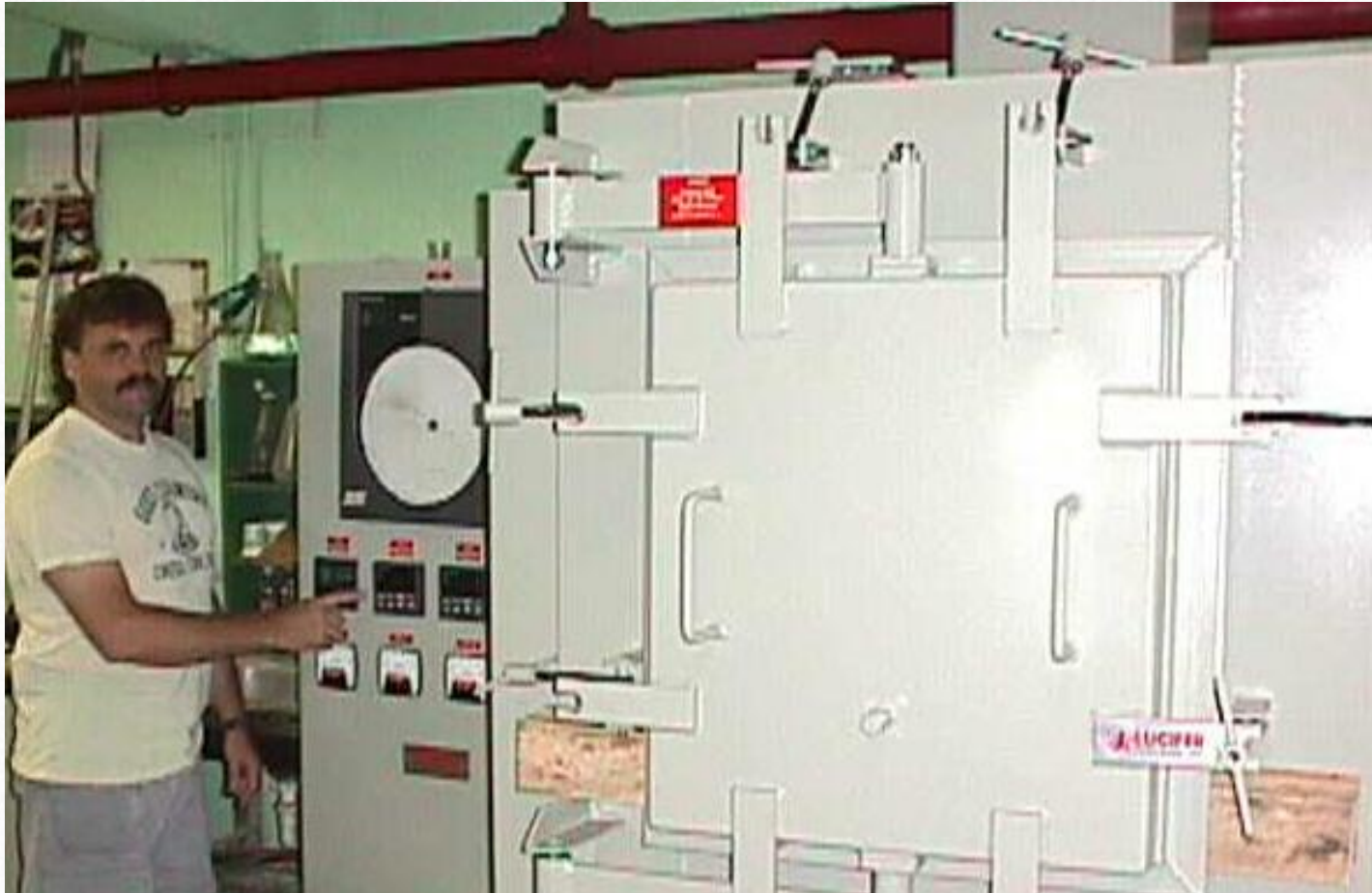
Painel de Controle de um Forno Eléctrico