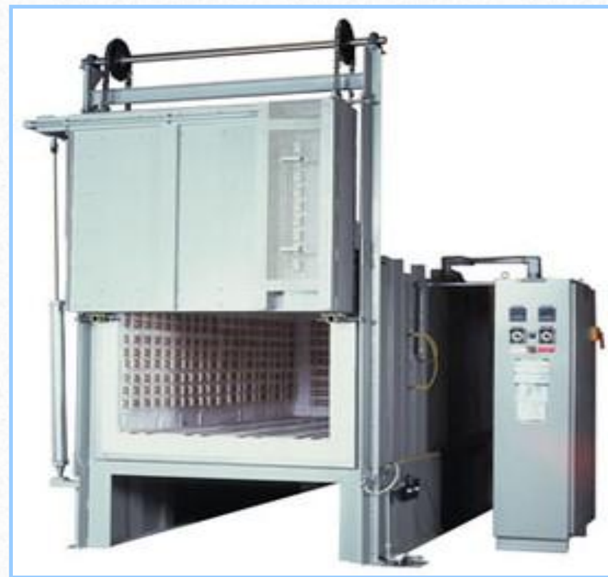
Forno eléctrico tipo contentor