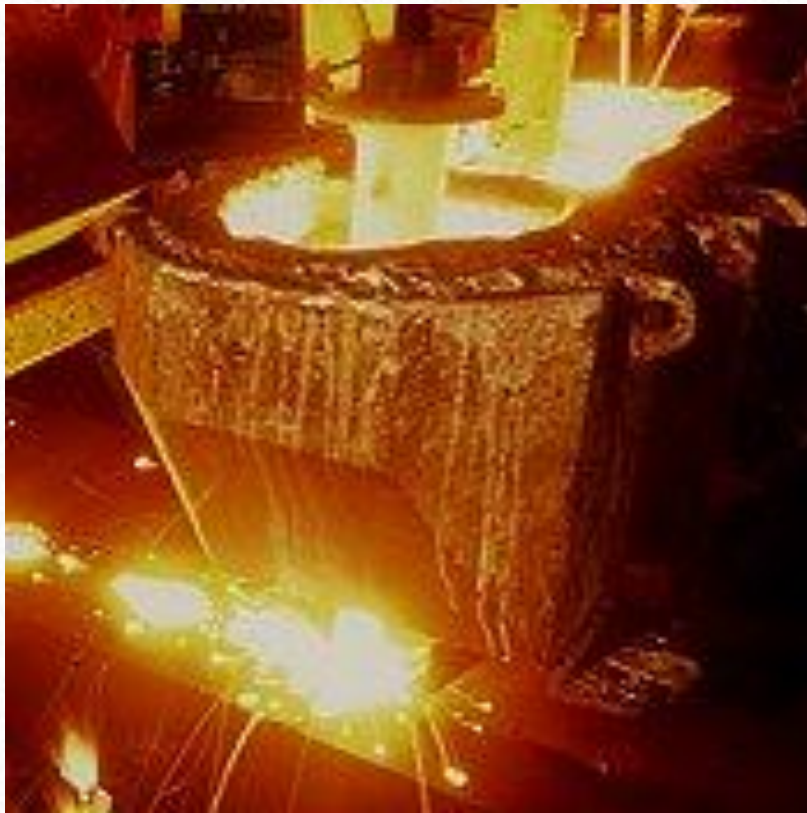
Forno eléctrico de Indução