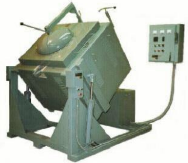
Forno eléctrico de resistência