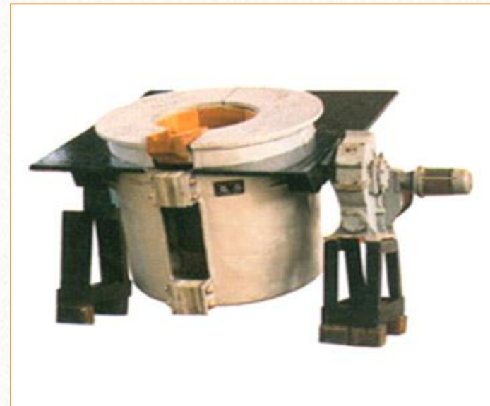
Forno eléctrico de Indução