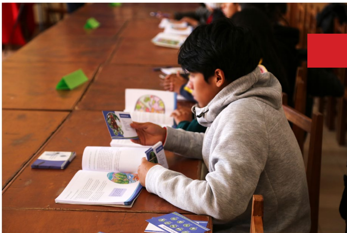
Niños de la Cuenca del río Azero durante las olimpiadas medioambientales

Los municipios co-organizadores de las olimpiadas fueron: Alcalá, Villa Vaca Guzman, Sopachuy, Monteagudo, Tarvita, El Villar y Azurduy.