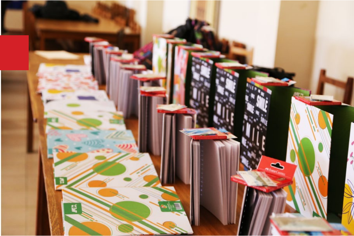
Paquetes de material escolar para las*os niñas*os participantes.

Las Olimpiadas fueron desarrolladas en tres fases: