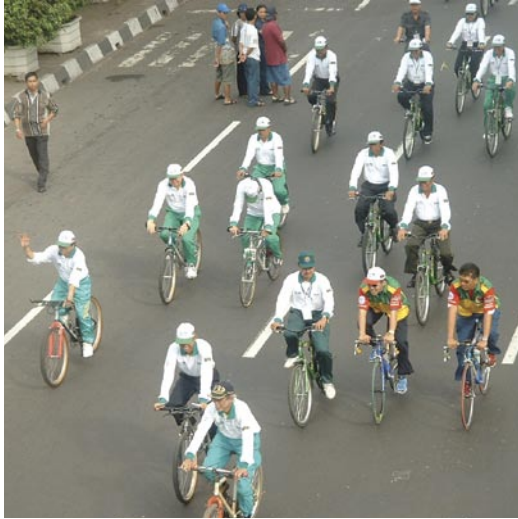
图8： 苏腊巴亚市议会的领导带领议会工作人员参加2002年5月30日的无汽车日活动。(Karl Fjellstrom, 2002.3)