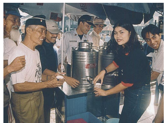
图3: www.ecoplan.org 链接 http://uncfd.org, 有活动资源 (www.ecoplan.org)