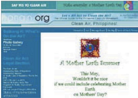
图 2： 拯救空气，参加空气净化，马尼拉 (www.hangin.org)