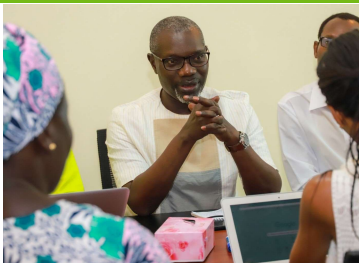
Photo à gauche : Atelier d'échange et de capitalisation du réseau des incubateurs partenaires