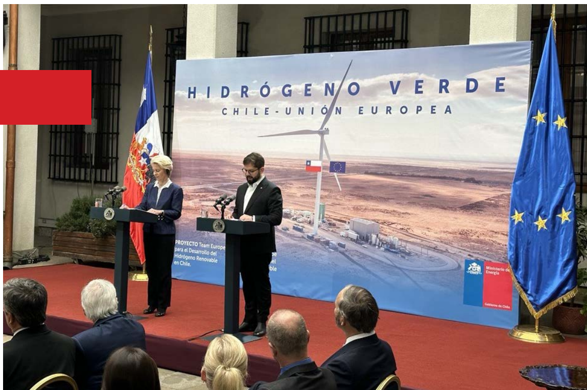
Ambos presidentes en un encuentro realizado en el Palacio de la Moneda de Chile.

A través de esta iniciativa se fortalecerá el entorno propicio para la economía del hidrógeno renovable; el desarrollo de capacidades y transferencia de conocimientos; el desarrollo tecnológico y las evaluaciones de impacto sobre infraestructura y sostenibilidad, entre otros.