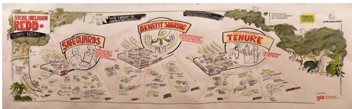
2 Documentación Gráfica I – Yasmine Cordes, bikablo; foto: GIZ/Jonathan Deis