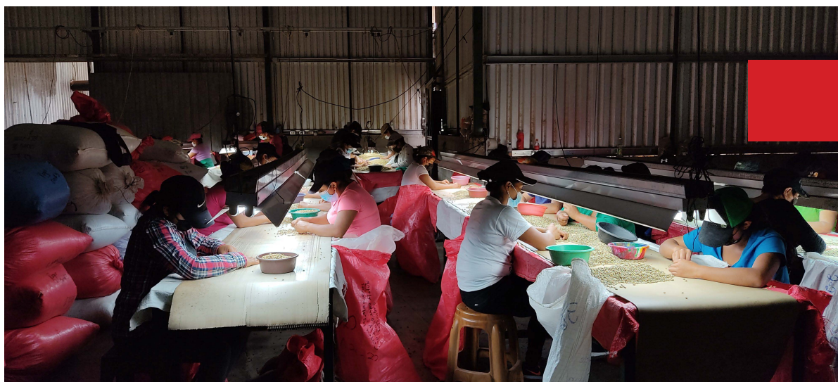
Procesado del café en Honduras

La importancia de la trazabilidad en la cadena de suministro del café para las cooperativas de productores se hace visible en tres nuevos videos de productores de Honduras. Con la ayuda de la herramienta de trazabilidad INATrace, que documenta digitalmente todo el recorrido desde el cultivo del café hasta el producto final, garantizando la transparencia y la rendición de cuentas en toda la cadena de suministro, los pequeños productores hondureños pueden digitalizar sus procesos internos. Conservan el control sobre sus propios datos, lo que refuerza su posición negociadora con los compradores.