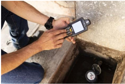
Revisión del consumo de agua en una empresa de agua, asesorada por el proyecto en México