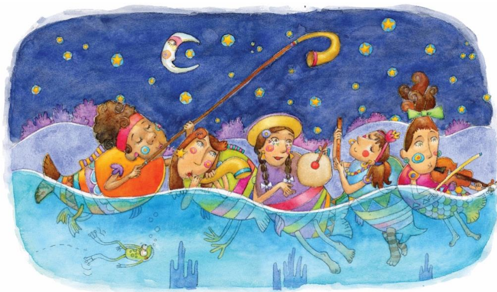
Imagen: Ilustraciones cuentos.

Problemas de sequías, contaminación de los ríos y fuentes de agua, cambios climatológicos extremos, afectan a las cuencas Azero (Chuquisaca) y Guadalquivir (Tarija). Estos problemas fueron retratados en cinco cuentos a través de personajes míticos y fantásticos, escritos por la afamada escritora Liliana De la Quintana.