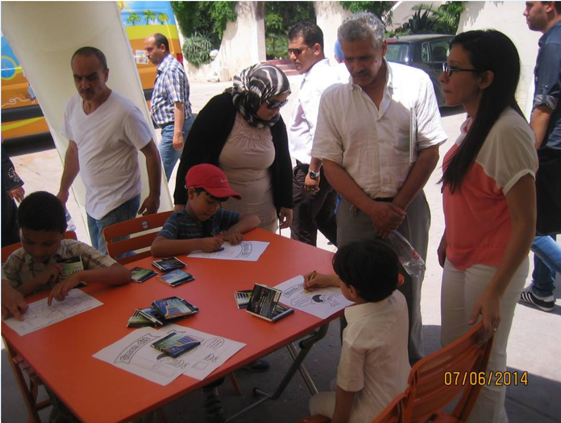
Le 07. Juin 2014 à El Menzah