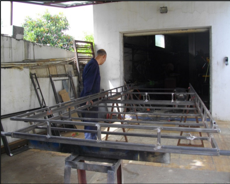
Confection de la galerie de toit et des supports pour panneaux solaires