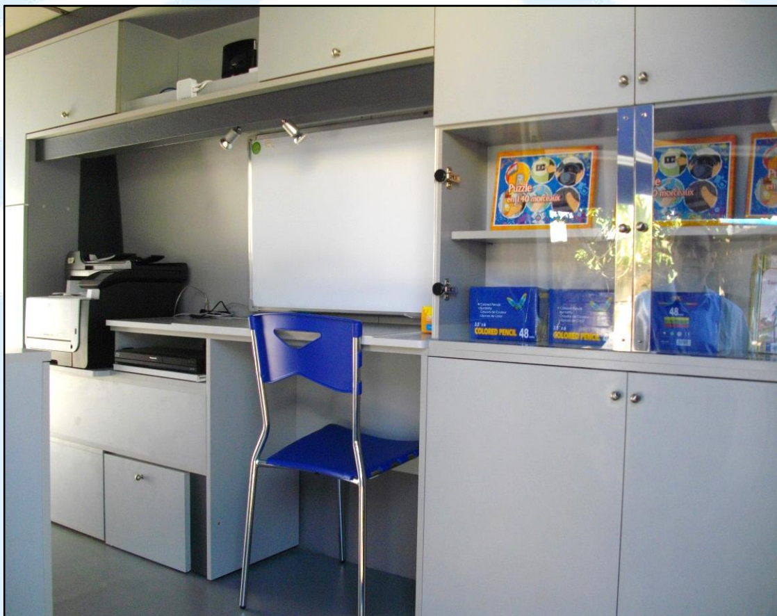
Aménagement et équipement du car dans son état final