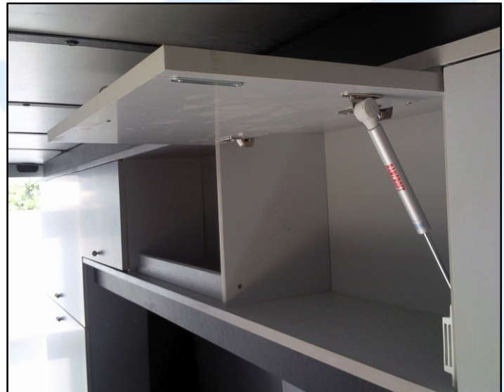
Aménagement de l'intérieur après confection sur mesure des éléments, meubles et armoires modulaires