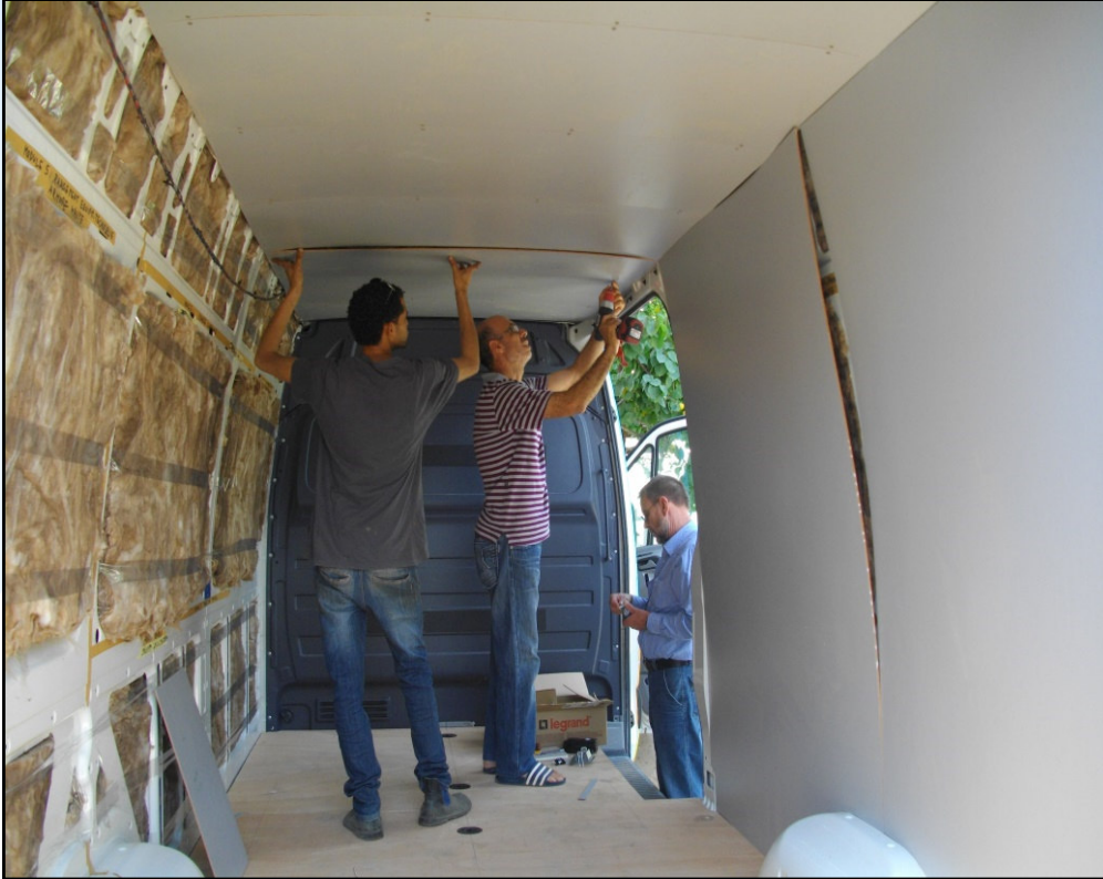
Isolation des parois et revêtement intérieur