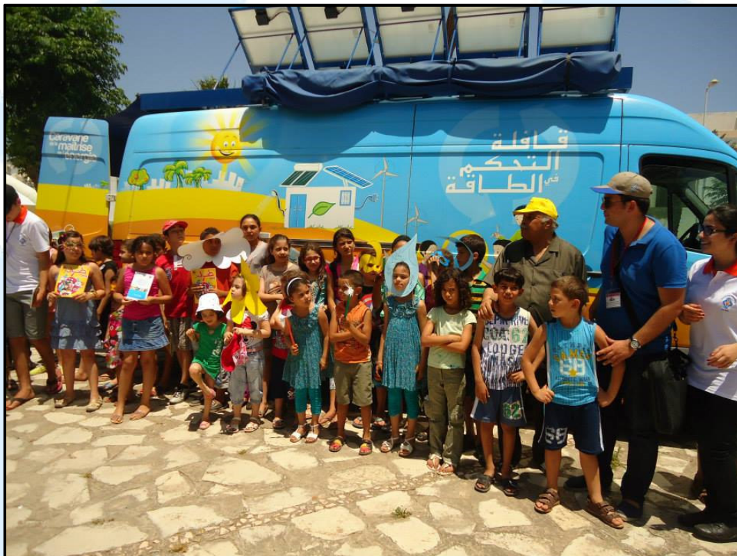
Action avec l'Association des jeunes Innovateurs le 21. Juin 2014 à Kelibia