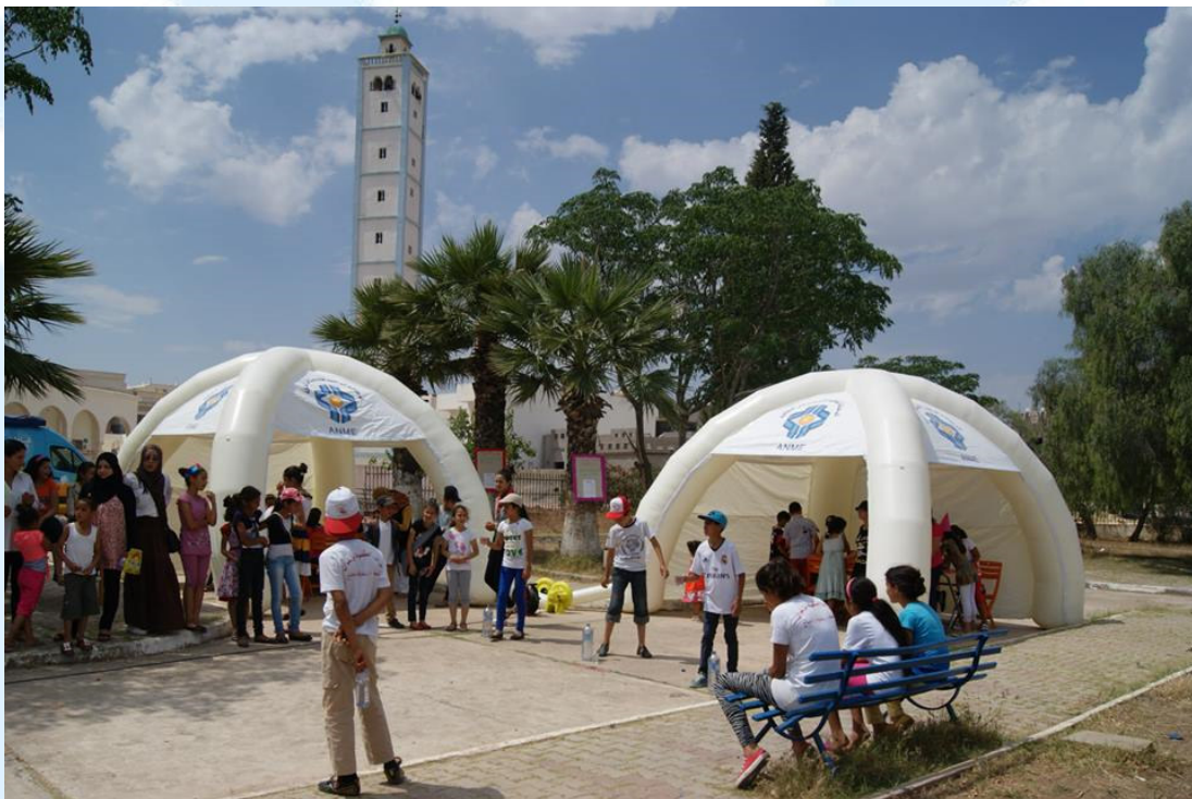
Le 15. Juin 2014 à Zaghouan