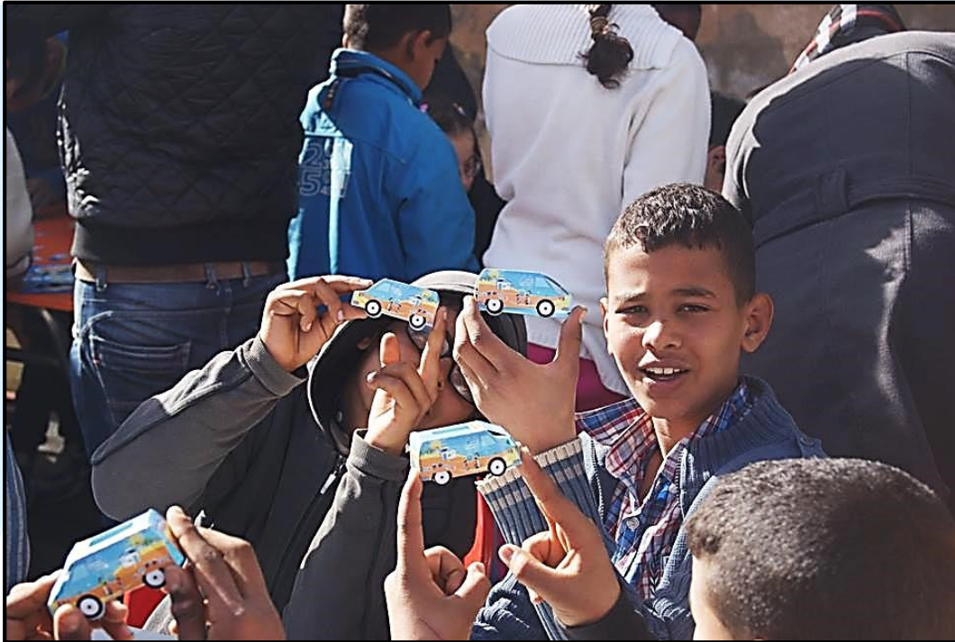
Action de sensibilisation au Club d'enfant Remada, du 16. au 18. Janvier 2015