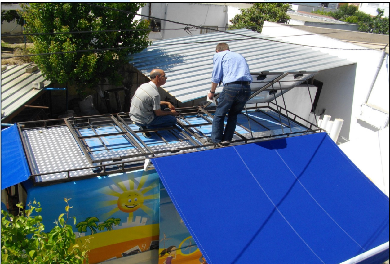
Montage des panneaux solaires après installation de la galerie de toit et de la marquise latérale et arrière