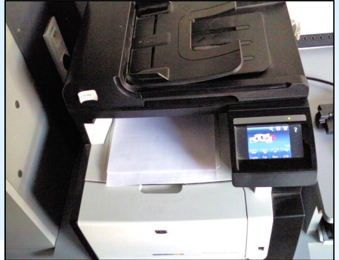
Équipements audiovisuels, informatiques et bureautiques installés